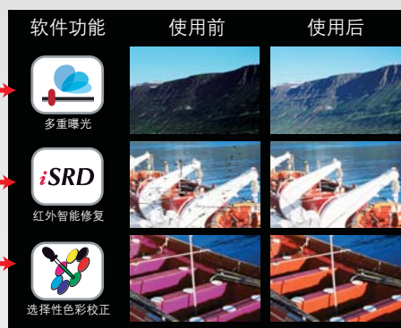
OpticFilm 8200i SE