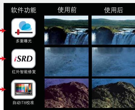
OpticFilm 8200i Ai