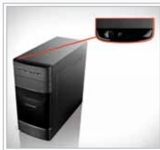
LENOVO RESCUE SYSTEM

Unkomplizierte Sicherung und Wiederherstellung Ihrer Daten.