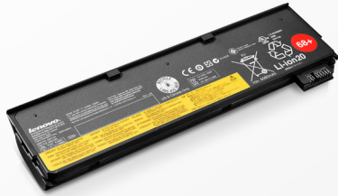
Batterie ThinkPad 68+ (6 cellules) (0C52862)