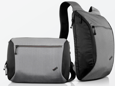
Sacoche à ouverture supérieure (0B47307) et sac à dos (0B47306) ThinkPad® Ultralight