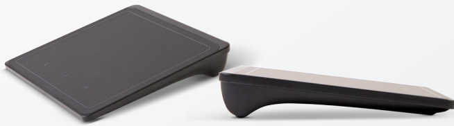
Pavé tactile sans fil Lenovo® (pour les modèles non tactiles de T440s) (0A33909)