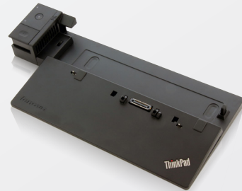
Station d'accueil ThinkPad Pro - 90 W (40A10090xx)